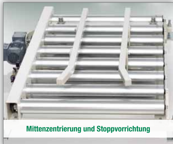
Mittenzentrierung und Stoppvorrichtung